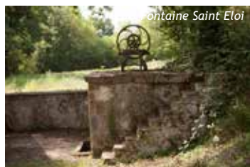
Fontaine Saint Eloi

En 2015, on recense 276 mailhocois et mailhocaises, soit une hausse de près de 23% par rapport à 1999. Au dernier recensement de 2017, la commune totalise 301 habitants.