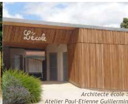
Architecte école : Atelier Paul-Etienne Guillermin