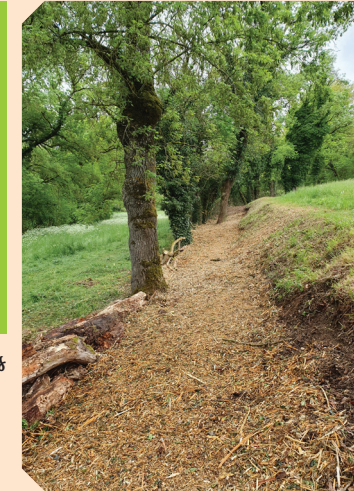
Entretien de sentiers

Conseil Départemental du Tarn, communes, Communauté de Communes Carmausin-Ségala